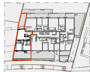
PLANTA PISO RC ESC. 1:1000