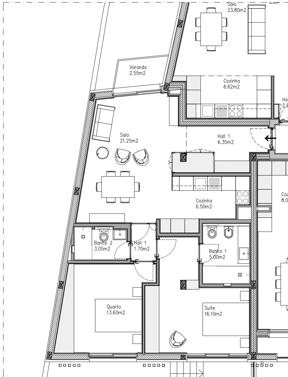
DESTAQUE PLANTA DA FRACÇÃO ESC. 1:100

Piso 1 - Fracção Direita - 2 Frentes Lugar de estacionamento nº11; Box fechada= 14.80m 2 ; Varanda/Pátio=2.55m 2