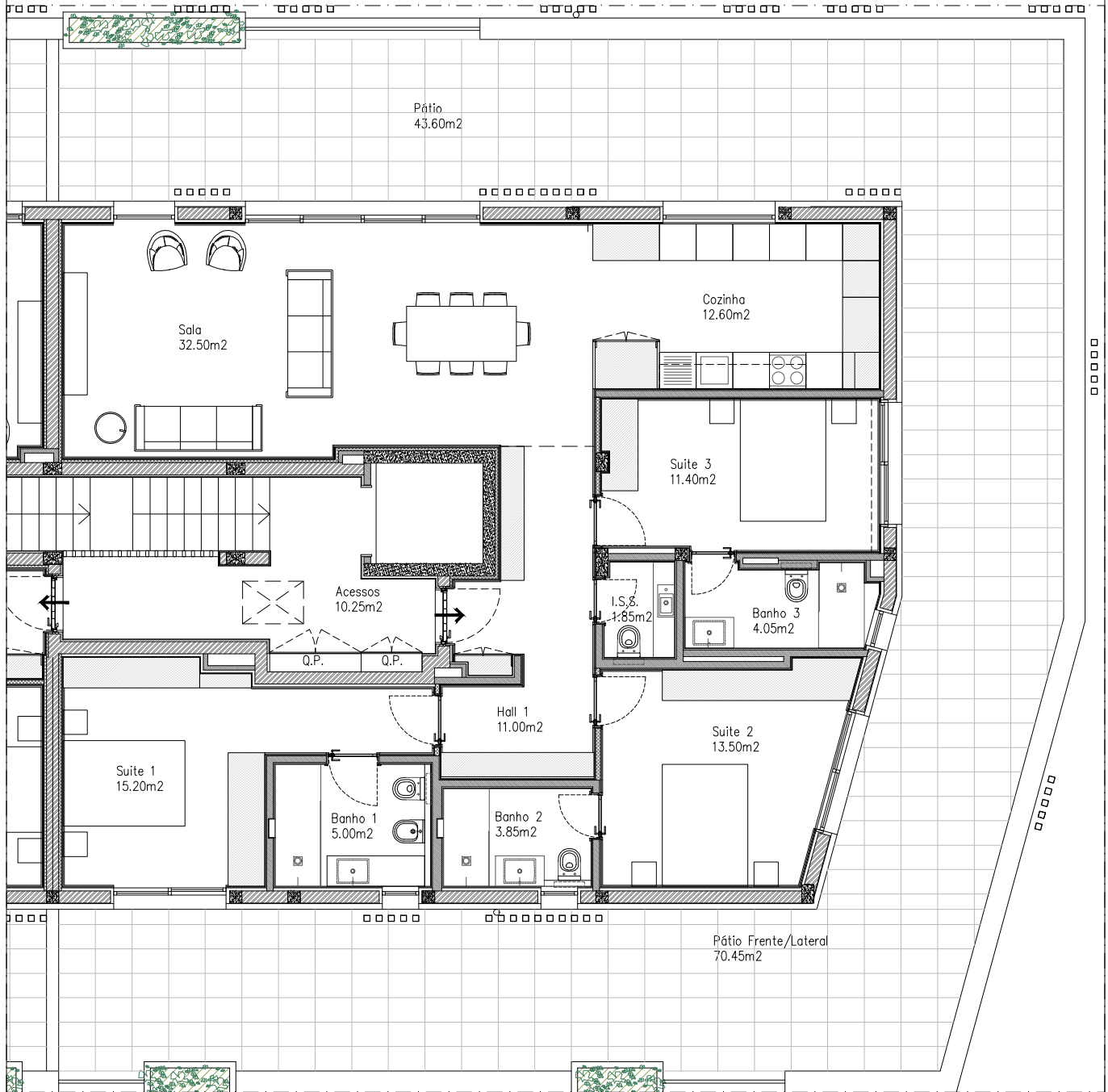
DESTAQUE PLANTA DA FRACÇÃO ESC. 1:100

Piso Recuado - Fracção Esquerda Lugar de estacionamento n.º 13, Box fechada = 14.60.00m 2 ; Varanda/pátio=43.60m 2 ; Pátio frente=70.45m 2